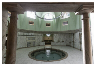
Les bains romains.

« Je suis prêt à parler de tout, je ne suis pas là pour imposer », insiste Juan Negrillo qui se donne une quinzaine de jours pour décider du futur fonctionnement des créneaux naturistes. Ils seront effectifs début mars, le temps d'adapter l'organisation des Bains.